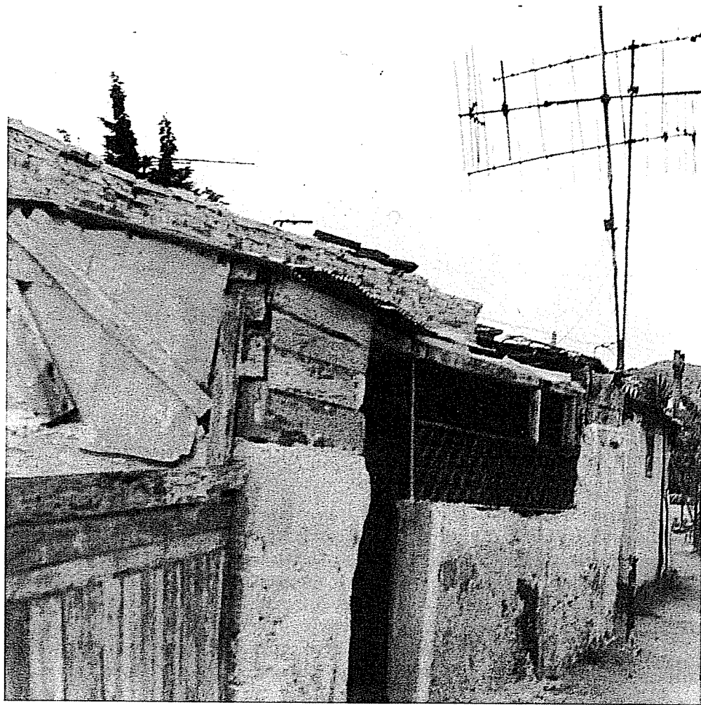
Η προσωρινή εγκατάσταση στο Λαύριο διαρκεί είκοσιπέντε χρόνια.

Η συγκλονιστικότερη ίσως περίπτωση εγκλωβισμού στην κοινωνική θέση των οικονομικά ασθενέστερων είναι η περίπτωση των ποντιακών οικογενειών που εγκαθίστανται το 1965 προσωρινά στο Λαύριο και τελικά παραμένουν στα ίδια ακατάλληλα οικήματα μέχρι σήμερα. Όταν η οικογένεια αυξάνεται, κατασκευές από χαρτόνι προστίθενται στο αρχικό οίκημα. Οι χάρτινες κατασκευές αργότερα αντικαθίστανται από κατασκευές με καταλληλότερα υλικά. Η περίπτωση του Λαυρίου δείχνει πως ακόμη και προβλήματα της πρώτης γενιάς όπως το στεγαστικό, τα οποία βρίσκουν λύση, έστω και μετά πάροδο αρκετών ετών, εξακολουθούν να υφίστανται σε τμήμα της δεύτερης γενιάς.