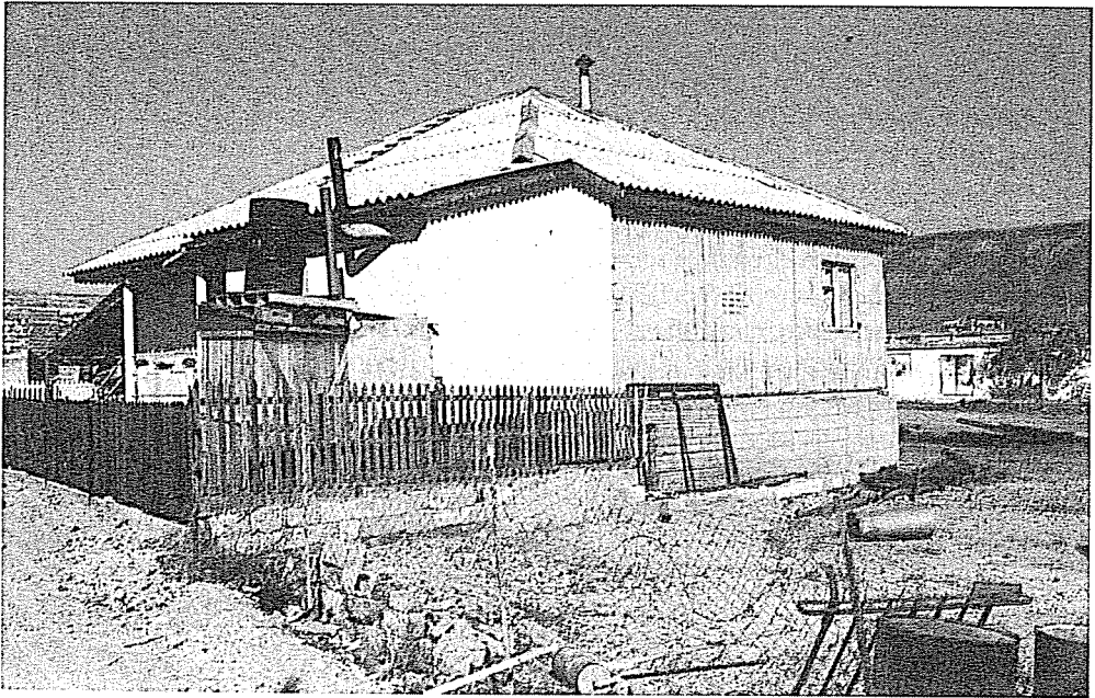
Προσφυγικό σπίτι στον Ασπρόπυργο το 1994. Για τοίχους χρησιμοποίησαν κομμάτια από τα κοντέινερ με τα οποία μετέφεραν την οικοσκευή τους στην Ελλάδα.

Οι μετανάστες αντιμετωπίζουν οξύτατο στεγαστικό πρόβλημα. Η εγκατάσταση εξακολουθεί να πραγματοποιείται συνήθως κοντά σε συγγενείς και φίλους που τους βοηθούν στην προσαρμογή στο νέο κοινωνικό περιβάλλον. Πρέπει όμως να τονιστεί ότι η βοήθεια του συγγενικού περιβάλλοντος σταδιακά χάνει την αποτελεσματικότητά της λόγω της αδυναμίας ανταπόκρισης στην επίλυση προβλημάτων, του πολύ μεγάλου πλέον αριθμού συγγενών, που αντιστοιχούν σε κάθε εγκατεστημένη ήδη οικογένεια.